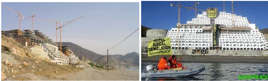
Carboneras. Hotel en construcción con orden de demolición y de expropiación 2006