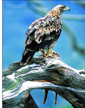
Ejemplar de águila imperial. / seo anclure

Villanueva de Gómez, Ávila. 2006 de 143 habitantes, 7500 chalés