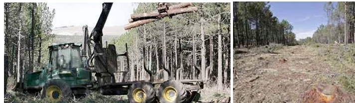
Navas del Marqués. Construcción de la ciudad del golf. Oct. 2006