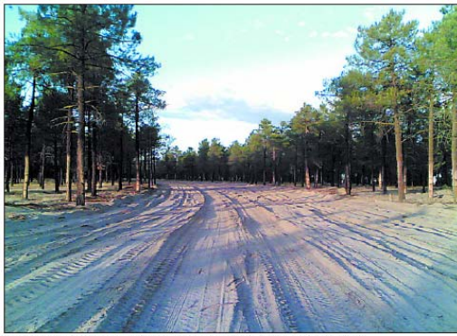
Zona del pinar de Villanueva de Gómez en donde se han talado 10.000 árboles. / seo anclure